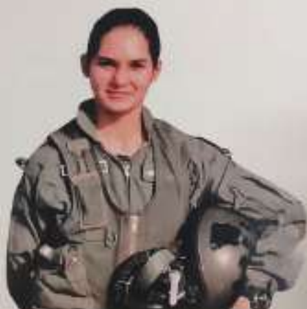
Ms. Avani Chaturvedi First Indian Woman Fighter Pilot